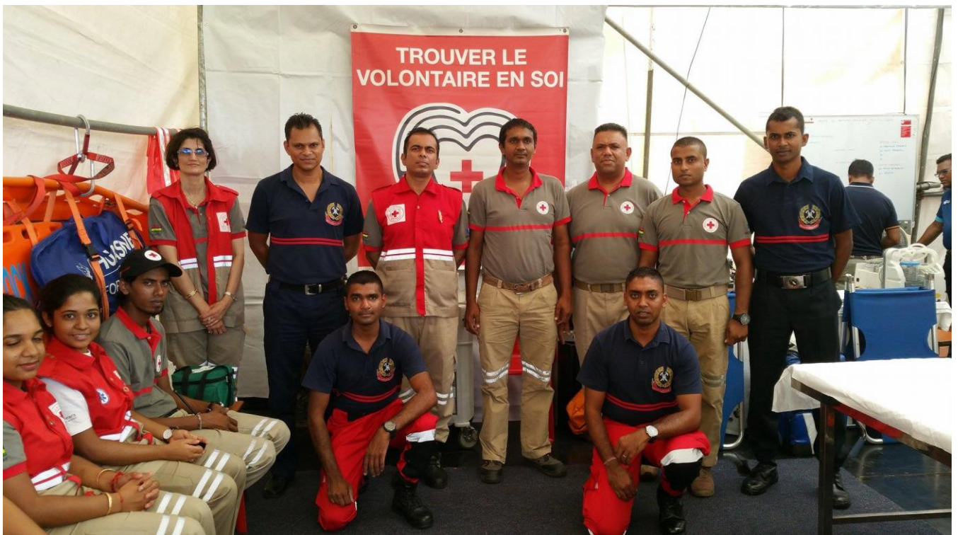
L'équipe de la Croix Rouge de Maurice et de la Mauritius Fire and Rescue Services