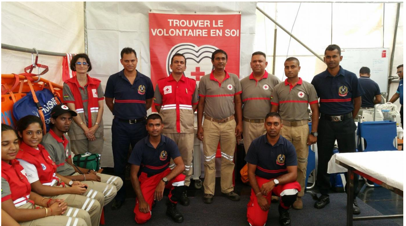
L'équipe de la Croix Rouge de Maurice et de la Mauritius Fire and Rescue Services